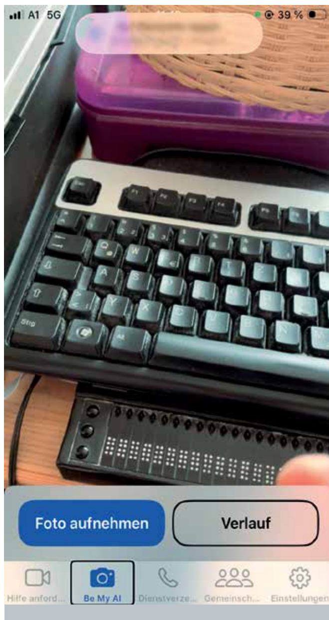
Screenshot der Fotoanzeige eines Smartphones, die App „Be My AI“ ist aktiviert.

Zum Geburtstag habe ich ein Kosmetikprodukt in einer Tube bekommen. Schusselig, wie ich manchmal