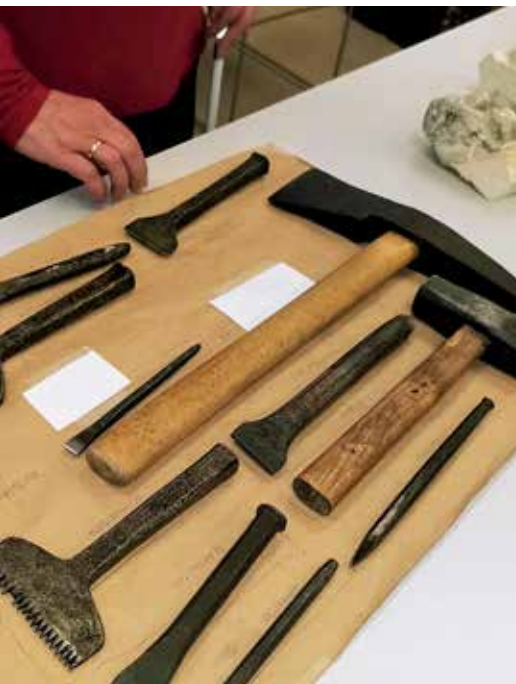
Werkzeuge, die bei der Taststation über den Stephansdom im Wien Museum aufliegen sollen, werden vorab ertastet.