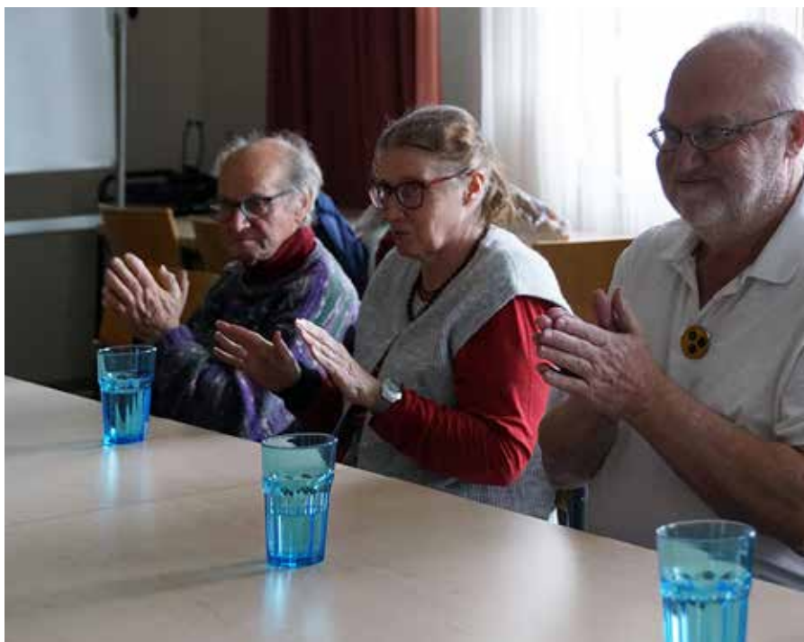
Die Teilnehmer:innen fühlen sich in der Gruppe wohl.

Die Vorstellung, an einer Demenzerkrankung wie an der Alzheimer Krankheit zu leiden, löst bei vielen Menschen unangenehme Gefühle wie Angst und Schrecken aus. Denn die Krankheit verändert einen Menschen, macht abhängig und hilflos, und ist bis jetzt nicht heilbar. Wir können aber mit einem gesunden Lebensstil einiges dazu beitragen, einer Demenzerkrankung vorzubeugen oder sie hinauszuzögern. Eine weitere Präventionsmaßnahme ist das Gedächtnistraining. Was genau versteht man darunter?